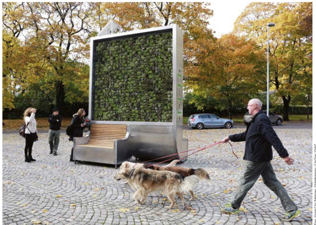
Mooswand in Oslo: Ein größeres Modell soll bald in Stuttgarts Innenstadt stehen.

In Versuchen haben sich Moose als gute Feinstaubfänger und -zersetzer erwiesen. Im Gegensatz zu anderen Pflanzen haben Moose keine Wurzeln. Sie sind darauf angewiesen, Wasser und Nährstoffe aus der Luft und dem Regenwasser zu ziehen. Genau das soll die Moose zum optimalen Luftfilter machen: Feinstaub-Partikel bleiben an der Oberfläche der Moose hängen und werden