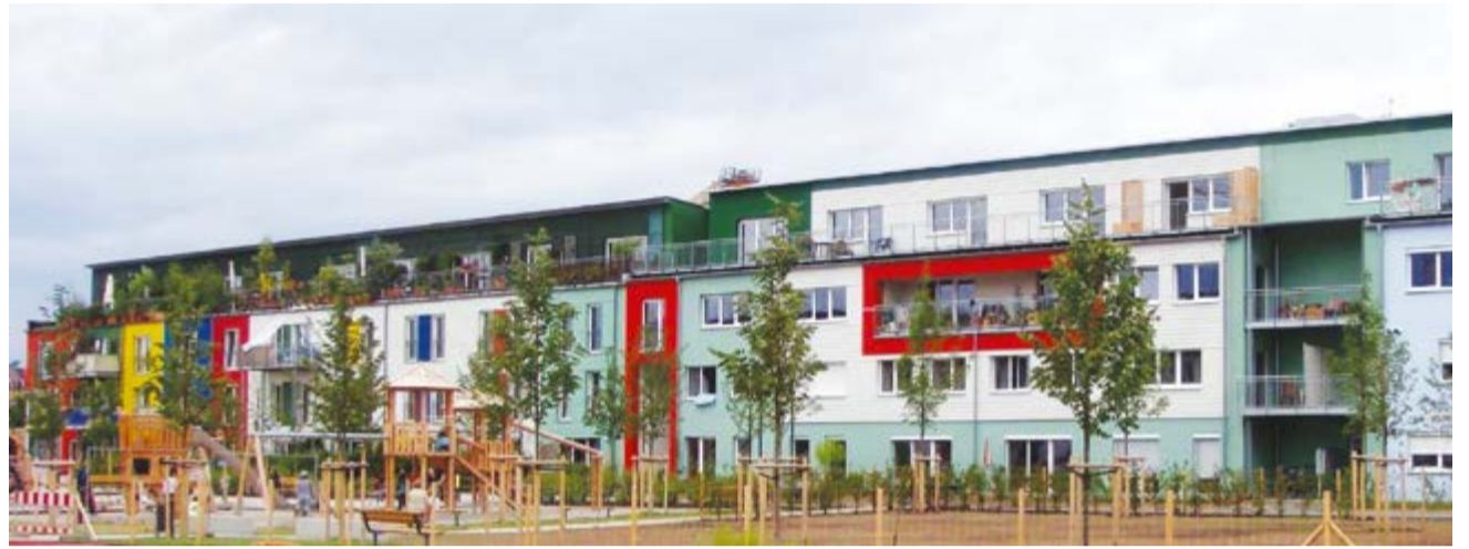
Hausprojekt für mehrere Generationen in Darmstadt: Wer nicht allein wohnen will, muss auch die Basisdemokratie aushalten.

Die Initiatoren des Wohnmodells, die 1998 dafür eine Genossenschaft gründeten, hatten hohe Ansprüche. Man wollte eine ausgewogene Mischung aus Jungen und Alten, Familien und Alleinerziehenden, Gutbetuchten, Mittelklasse und ärmeren Bewohnern; mindestens zehn Prozent sollten Behinderte sein, ebenfalls zehn Prozent Menschen mit Migrationshintergrund.