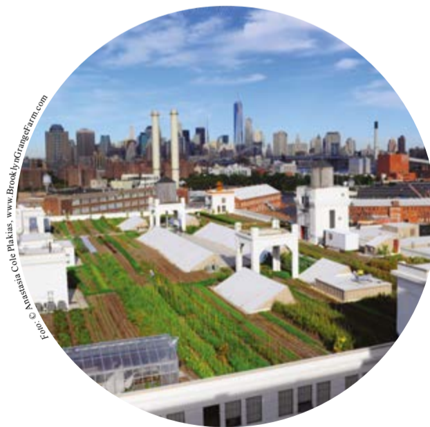
Dächer sind in den meisten Städten ungenutzte Flächen – die Brooklyn Farm macht vor, wie Dächer zu Äckern werden können.

die Qualität des kühlen – und im Falle von New York dreckigen – Nasses. Vor allem aber formieren sie sich zu Gebilden, die Riffen ähneln. Perspektivisch, so der Gedanke, sollen sie so einmal Wellen brechen können. Die Angst vor meterhohen Wellenmonstern, wie „Sandy“ sie 2012 ausgelöst, sitzt tief. „Das Austernbett wird mehrere Zwecke erfüllen“, sagt denn auch New Yorks Bürgermeister Bill de Blasio. „Es ist ein kleiner, aber notwendiger Schritt, um unsere Stadt nachhaltiger und widerstandsfähiger zu machen.“